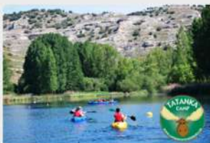
Campamentos Tatanka Group. 2020