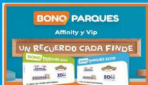
Bonos Parques reunidos 2020