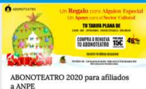
ABONOTEATRO 2020 para afiliados a ANPE