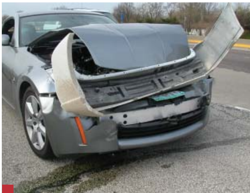
El seguro contratado por la Consejería de Educación ampara a todos los profesores a que hace referencia el Acuerdo de Itinerantes de 28 de marzo de 2001

Quedan excluidas de estas garantías los daños derivados de enfermedades anteriores; de renuncia o adelanto de traslado del accidentado; de otras enfermedades; de accidentes laborales; de participación del