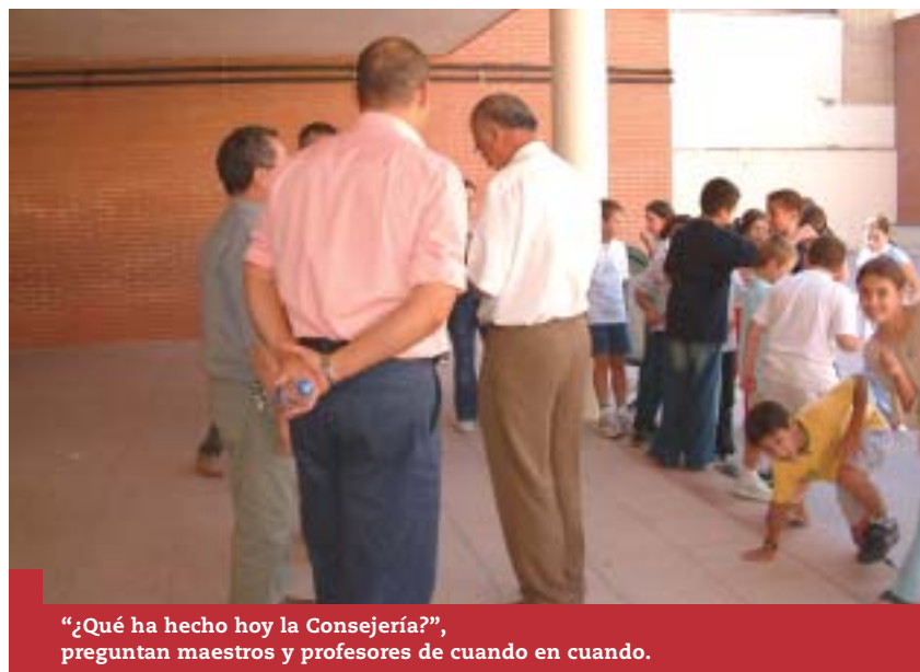
"¿Qué ha hecho hoy la Consejería?", preguntan maestros y profesores de cuando en cuando.

Vista la situación llamamos la atención a nuestra querida Consejería de Educación para pedirle, con impaciencia madura (no infantil), la foto de los puestos de difícil desempeño, la clasificación, de una vez por todas y sin retrasos, con el dinerito prometido y sin intentos de confusión